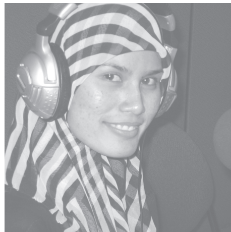
Een jonge vrijwilliger presenteert een radio-uitzending op 'radio Antero', in de regio Aceh, die in december 2004 door de tsunami getroffen werd.